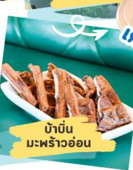
บั้งน มะพร้าวอ่อน