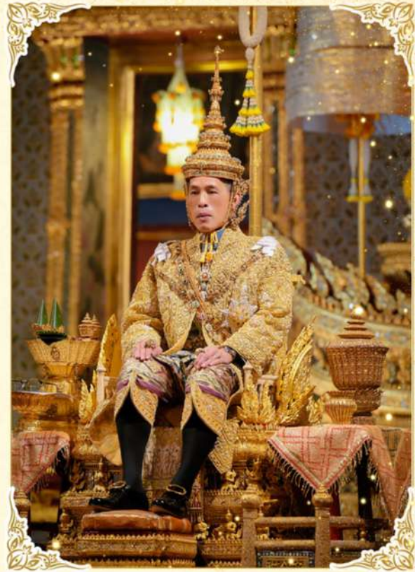
พระบาทสมเด็จพระเจ้าอยู่หัว His Majesty the King of Thailand

The Royal Activities of His Majesty the King of Thailand published on the Celebrations on the Auspicious Occasion of His Majesty the King's 6th Cycle Birthday Anniversary 28th July 2024