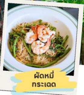
ผัดหมี่ กระจ่าง

คาเฟ่ท่ามกลางสวนมะพร้าว มีทั้งอาหาร เครื่องดื่ม เบเกอรี่ เมนูอาหารขึ้นชื่ออย่างผัดไทย ผัดหมี่กระจ่าง และที่พลาดไม่ได้คือเมืองคำโบราณ สูตรคุณยาย เสริฟพร้อมทั้งน้ำจิ้มรสเด็ด เครื่องดื่มก็มีให้เลือกหลาย ทั้งกาแฟ ชา โกโก้ และเมนู signature อย่างน้ำส้มแท้ 3 สายพันธุ์ รสชาติหวานอมเปรี้ยวดื่มแล้วให้ความสดชื่นสุดๆ ของหวานอย่างเด็กมะพร้าวอ่อน เด็กส้ม และขนมบั้งนมะพร้าวอ่อนที่กรอบนอกนุ่มใน เนื้อมะพร้าวแน่นๆ และด้านนอกยังมีช็อคโกแลตเยี้ยว สัมตำ รอให้คุณมาเพลิดเพลินกับความอร่อยด้วยคะ