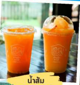
น้ำส้ม 3สายพันธุ์