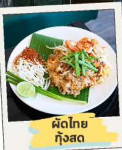
ผัดไทย กุ้งสด