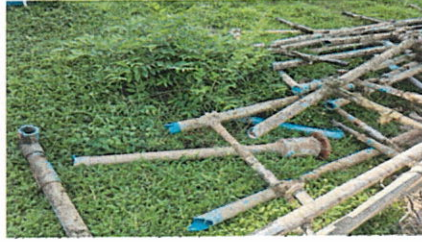
ลำดับที่ 5 ท่อ PVC.