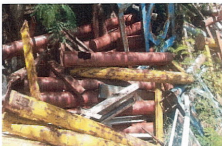
ลำดับที่ 19 ท่อเหล็ก