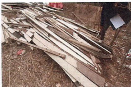
ลำดับที่ 14 ไม้ฝา (แบน) หนา 3"