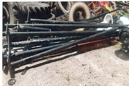
ลำดับที่ 18 เสาคอมไฟ