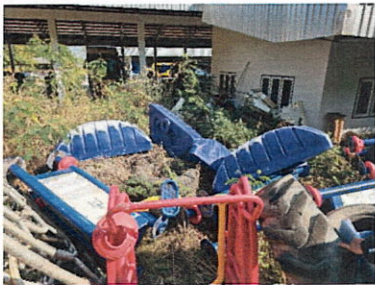
ลำดับที่ 12 สถานีบริหารหัวไหล่ และหน้าอก