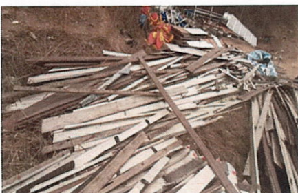
ลำดับที่ 13 ไม้ฝา (แบน) หนา 5"