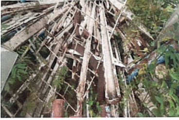
ลำดับที่ 1 เหล็กกล่อง