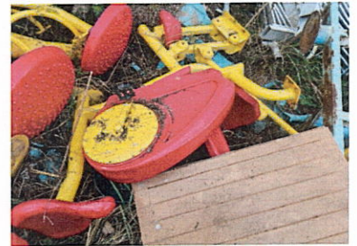
ลำดับที่ 11 สถานีออกกำลังกาย 5 ด้าน