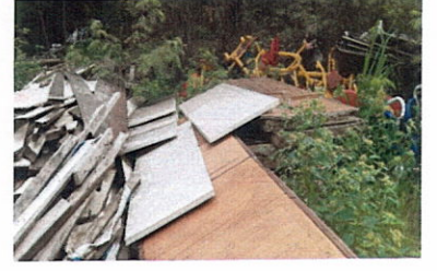
ลำดับที่ 3 ประตูป PVC.