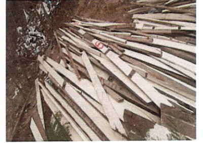
ลำดับที่ 12 ไม้ฝา (แบน) หนา 6"