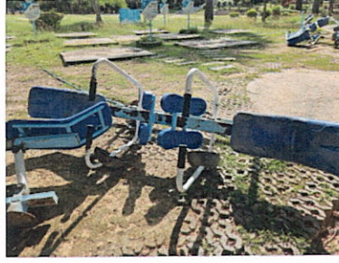
ลำดับที่ 3-4 อุปกรณ์บริหารแขน FTL 03