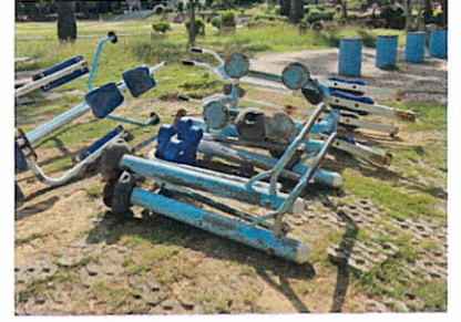
ลำดับที่ 5-6 อุปกรณ์โยกกรรเชียงบคู่