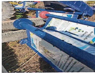
ลำดับที่ 13 สถานีนั่งปั่นจักรยาน