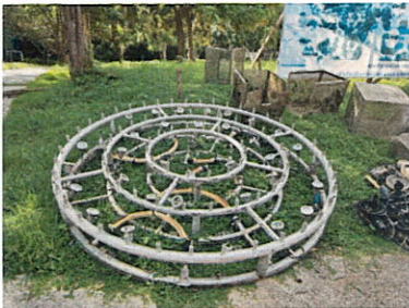
ลำดับที่ 10 ชุดหัวน้ำพุวงกลม