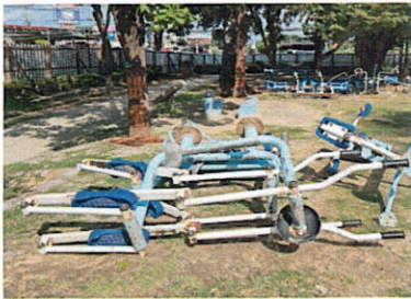
ลำดับที่ 7-8 อุปกรณ์เดินสลับแขน ขา FTL 22