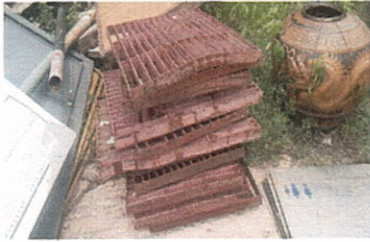
ลำดับที่ 4 ตะแกรงเหล็กแบน