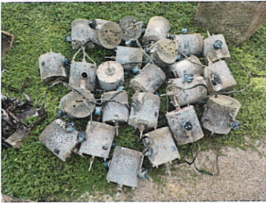
ลำดับที่ 7 ชุดหัวน้ำพุ