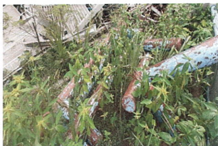
ลำดับที่ 20 ท่อเหล็ก