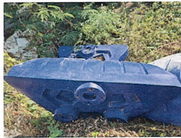
ลำดับที่ 16 สถานีแกว่งขา