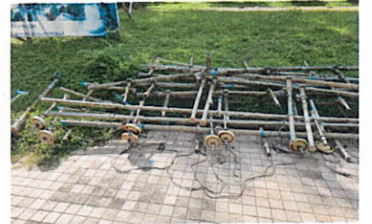
ลำดับที่ 6 ท่อเหล็ก