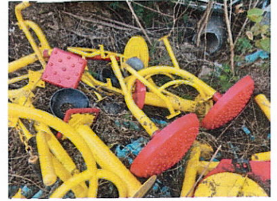
ลำดับที่ 14 สถานีล้อหมุนบริหารหัวไหล่