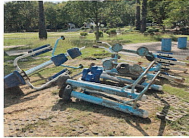
ลำดับที่ 9-10 อุปกรณ์เดินอากาศ FTL 24