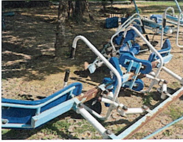
ลำดับที่ 1-2 อุปกรณ์บริหารแขน FTL 01