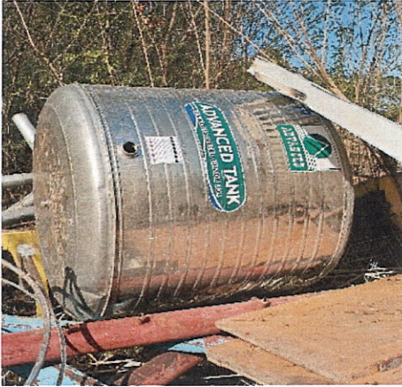
ลำดับที่ 25 แทงค์น้ำสแตนเลส