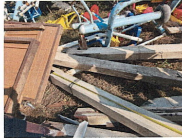
ลำดับที่ 11 เสामี