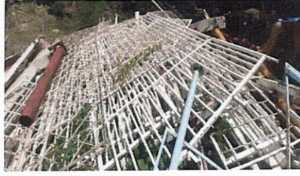
ลำดับที่ 2 เหล็กตะแกรง