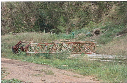
ลำดับที่ 16 โครงเหล็กถัก