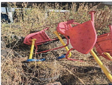
ลำดับที่ 15 สถานีฝึกการก้าวเดิน