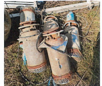
ลำดับที่ 9 ป้อนน้ำพุ