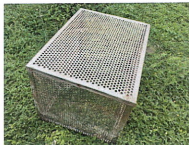
ลำดับที่ 8 กล่องตะแกรงสแตนเลส