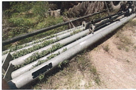
ลำดับที่ 17 เสาค้ำไฟฟ้า