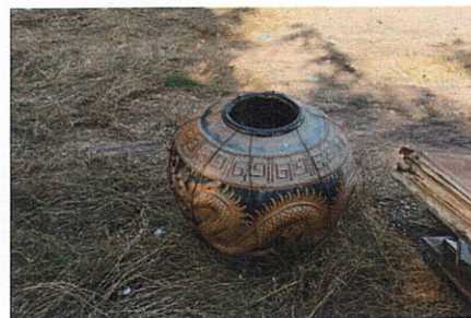
ลำดับที่ 21 โอ่งมังกร