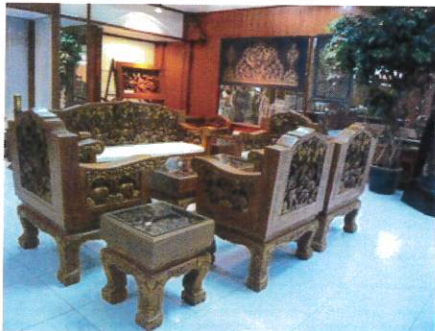
หมายเลข 10-0006 วันที่ถ่าย 09/09/2008