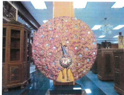
หมายเลข 10-0006-1 วันที่ถ่าย 09/09/2008