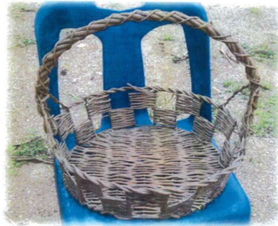
หมายเลข ๓๒๐๐๒๒ วันทนาย ๐๖/๐๙/๒๐๐๘