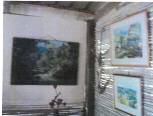
หมายเลข 10-0005-1 วันที่ถ่าย ๒๔/๐๙/๒๐๐๘