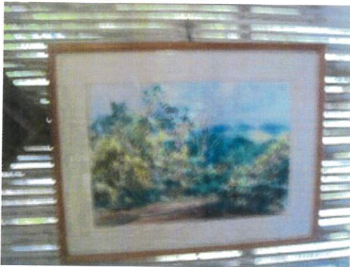
หมายเลข 10-0005 วันที่ถ่าย ๒๔/๐๙/๒๐๐๘