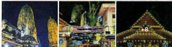
ภาพ / ข่าว ทีมงานประชาสัมพันธ์ของ.ราชบุรี #องค์การบริหารส่วนจังหวัดราชบุรี #เชื่อมั่นมั่นใจเราจะขับเคลื่อนราชบุรีไปด้วยกัน