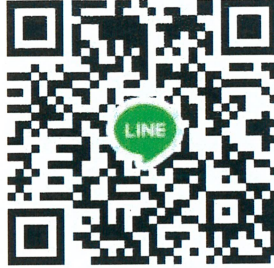
รูป Profile กลุ่มไลน์

๑.๑ สั่งสินค้าผ่านกลุ่มไลน์ “Order นมหนองโพ กสส.” โดยสามารถเข้าร่วมกลุ่มไลน์ได้ตาม QR Code นี้